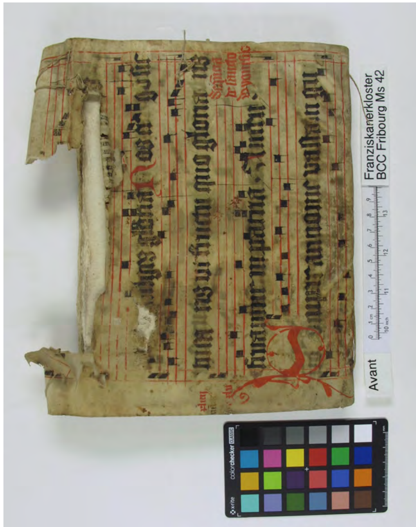
BCCFribourg, Ms 42: Cahier médical (XVI e s.). Papier, 72 feuilles, 23.2 x 18.3 x 2.9 cm.

Les contributions sont gérées par la Fondation pour la rénovation et la conservation du Couvent des Cordeliers Fribourg et peuvent être déduites des impôts. Les noms des donateurs et donatrices seront mentionnés dans le volume.