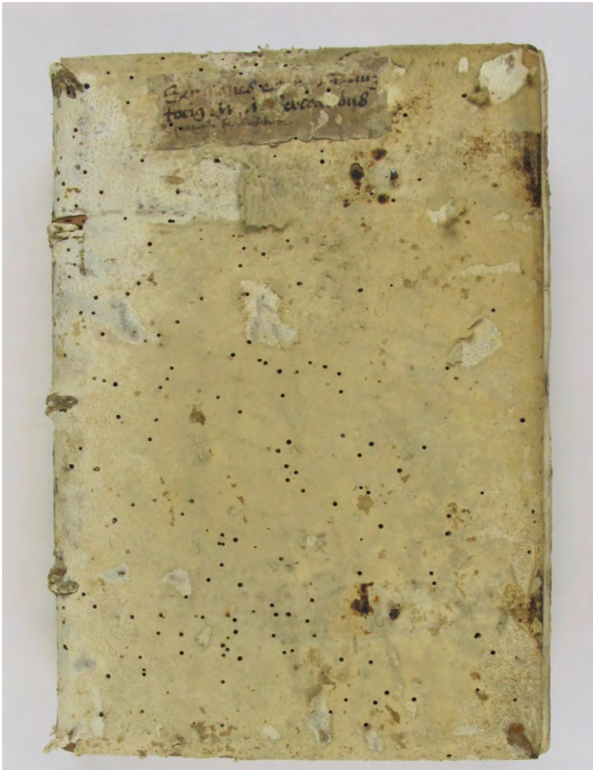
BCCFribourg, Ms 18: Bertrandus de Turre: Sermones (XV e s.). Papier, 216 feuilles, 30.4 x 21.8 x 6.3 cm.

Les contributions sont gérées par la Fondation pour la rénovation et la conservation du Couvent des Cordeliers Fribourg et peuvent être déduites des impôts. Les noms des donateurs et donatrices seront mentionnés dans le volume.